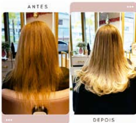
Preenchimento de pontas com Mega Hair, com a técnica invisível.