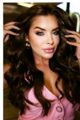
Maquiagem express e escova com babylliss