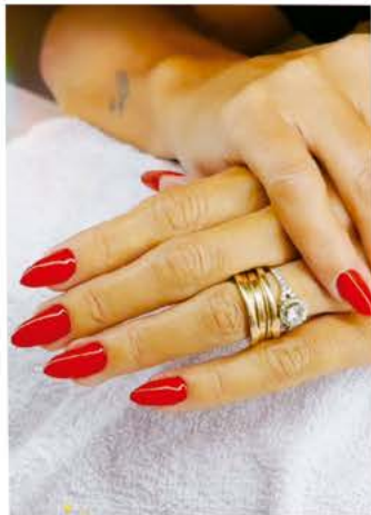
Esmaltação de gel