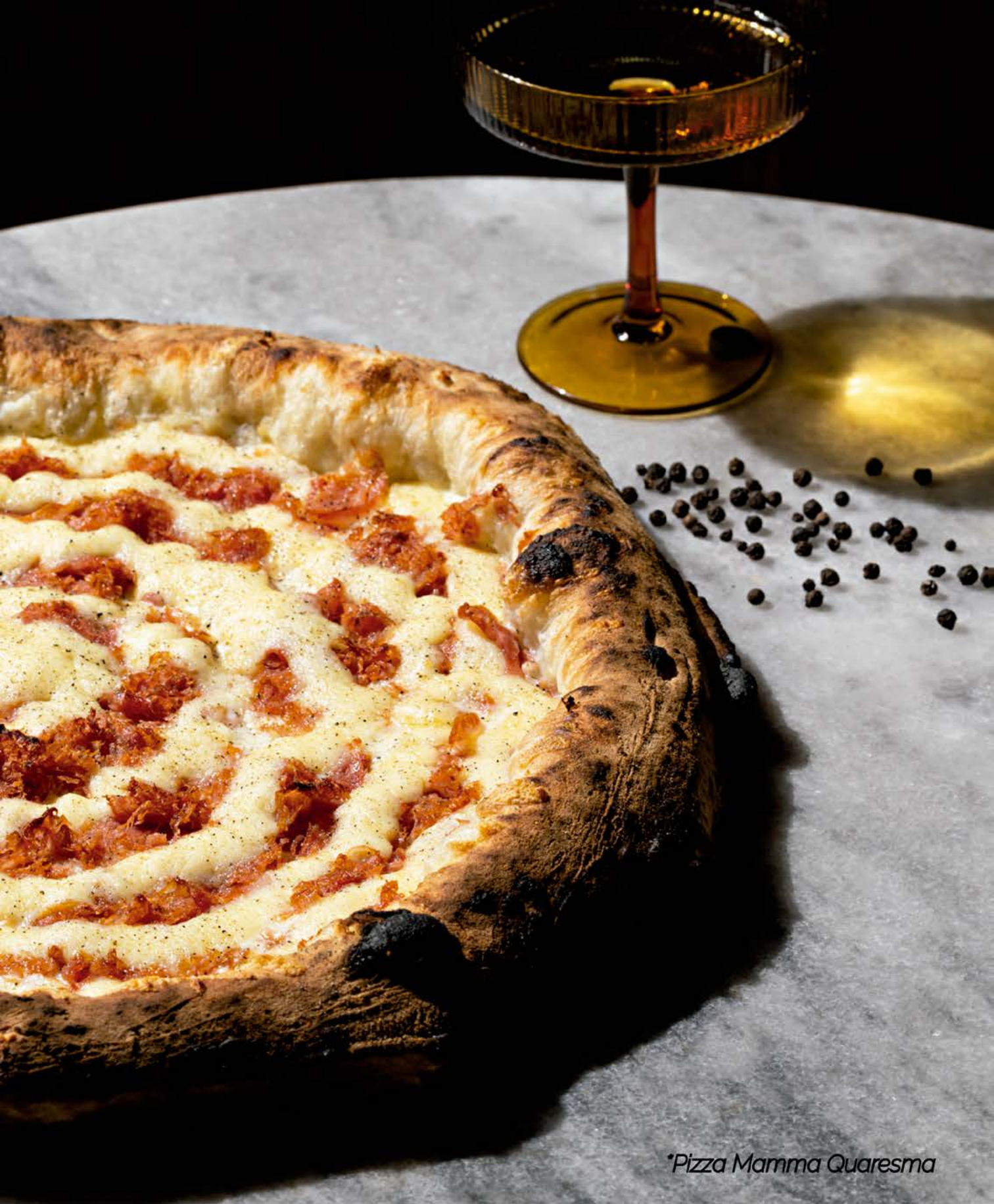
*Pizza Mamma Quaresma

CASASHOPPING Av. Ayrton Senna, 2150 Loja A - Bloco O