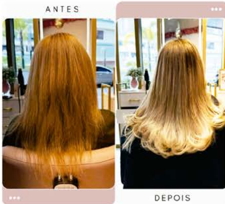
Preenchimento de pontas com Mega Hair, com a técnica invisível.